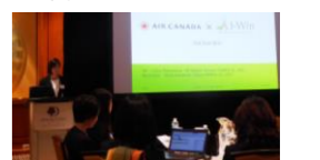
■2017年11月 海外研修 (カナダ・トロント)の様子