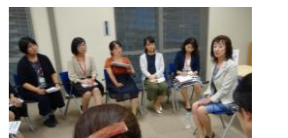
■2017年8月 関西支部定例会の様子 ※ラウンドテーブル