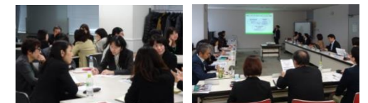
■2017年度 ダイバーシティ推進責任者会議の様子