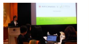
■2017年11月 海外研修 (カナダ・トロント)の様子