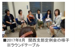
■2017年8月 関西支部定例会の様子 ※ラウンドテーブル