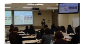
■2017年11月 関西支部定例会の様子