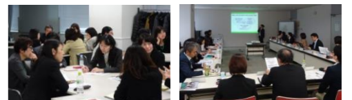
■2017年度 ダイバーシティ推進責任者会議の様子