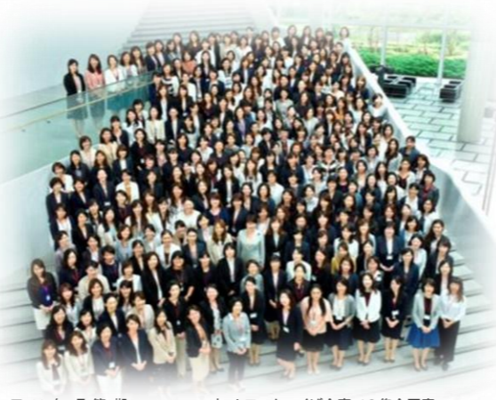
■2017年6月 第7期High Potentialネットワーク つくば合宿での集合写真